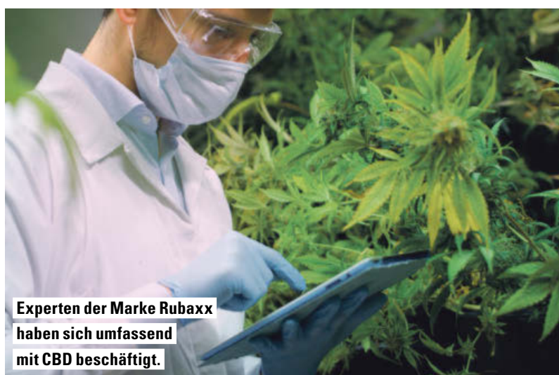
Experten der Marke Rubaxx haben sich umfassend mit CBD beschäftigt.

Eine CBD-Innovation aus der Apotheke begeistert derzeit Millionen Deutsche. Denn: Experten ist es gelungen, ~ 600 mg reines CBD (Cannabidiol) aus der Cannabispflanze sativa L. zu isolieren und in dem frei verkäuflichen Rubaxx Cannabis CBD Gel als Kosmetikum (Apotheke) aufzubereiten. Das Nr. 1* CBD Gel aus der Apotheke wurde zusätzlich mit Menthol und Minzöl zur Pflege beanspruchter Muskeln angereichert.